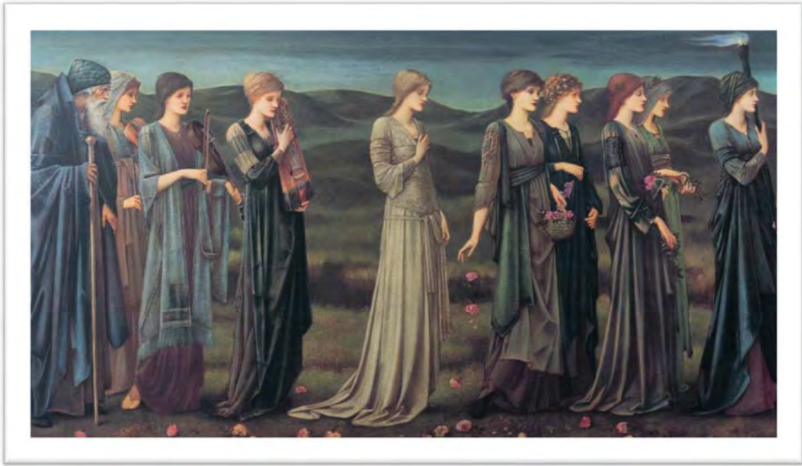
Burne-Jones, Edward. Psyche's Wedding . 1895.

https://www.wikiart.org/en/edward-burne-jones/the-wedding-of-psyche-1895