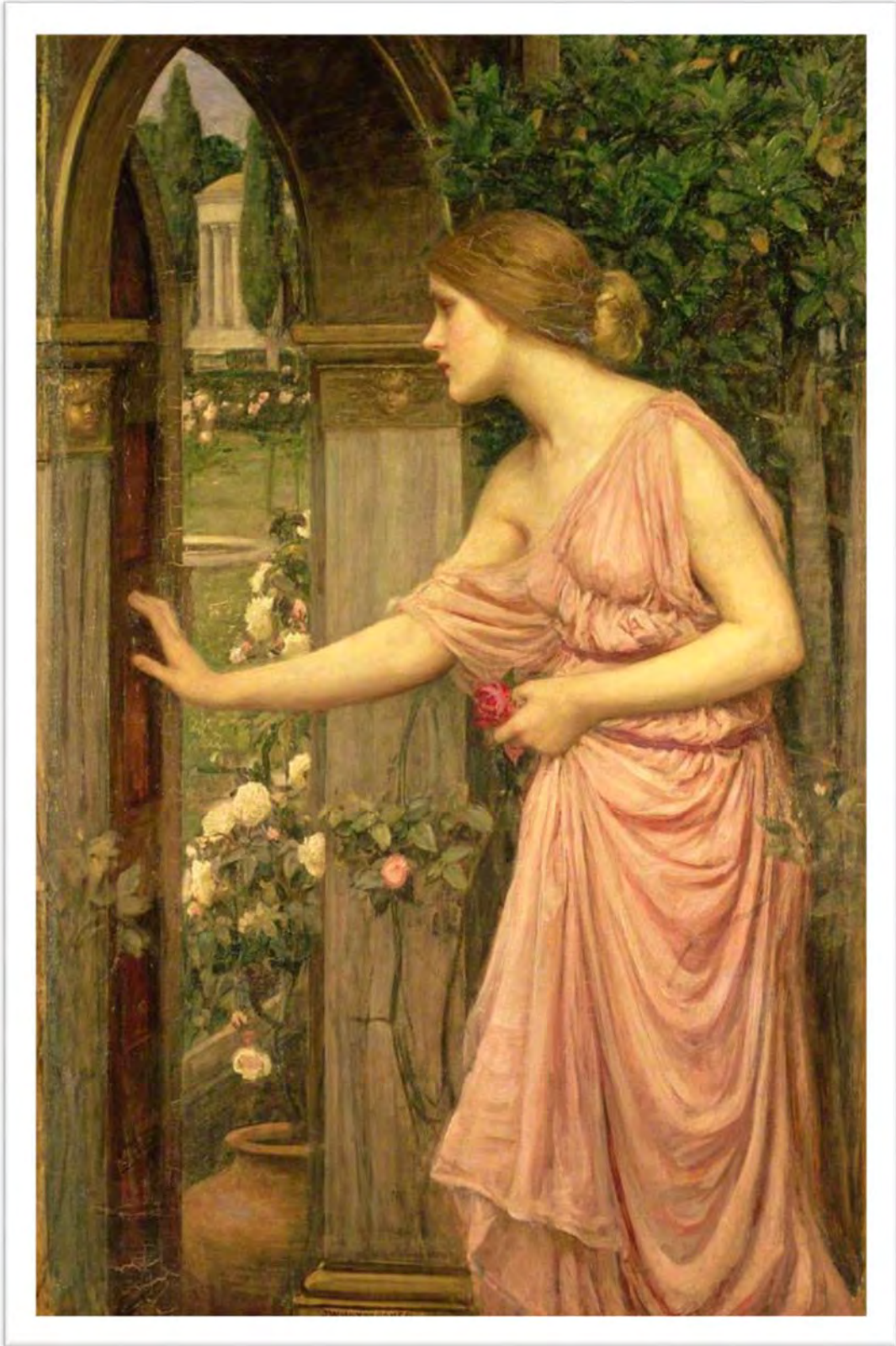
Waterhouse, John. Psyche Entering Cupid's Garden . 1904. https://artuk.org/discover/artworks/psyche-entering-cupids-garden-152596