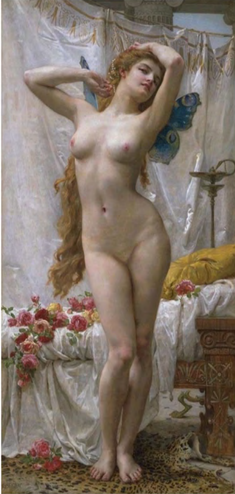
Seignac, Guillaume. The Awakening of Psyche . 1904. http://www.the-athenaeum.org/art/detail.php?ID=21786