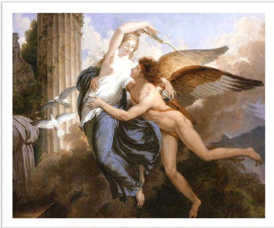
Saint-Ours, Jean-Pierre. The Reunion of Cupid and Psyche . 1793. https://collections.lacma.org/node/201898