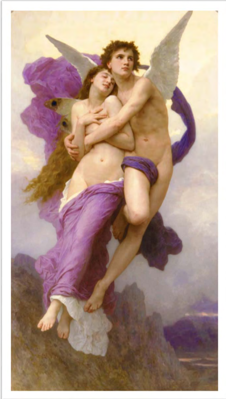
Bouguereau, William-Adolphe. The Abduction of Psyche . 1895. https://commons.wikimedia.org/wiki/File:Psycheabduct.jpg