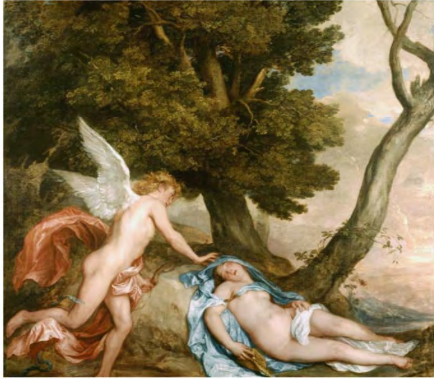
Van Dyck, Anthony. Cupid and Psyche . 1640.

https://www.rct.uk/collection/405571/cupid-and-psyche