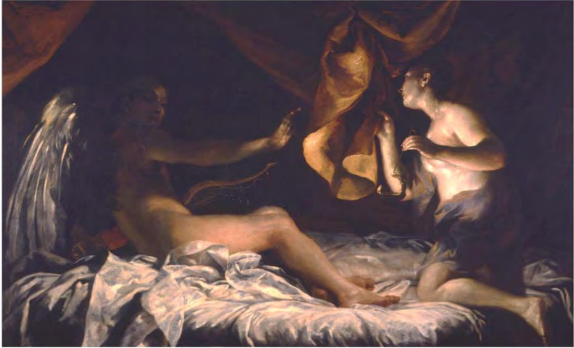
Crespi, Giuseppe. Cupid and Psyche . 1709.

https://artsandculture.google.com/asset/cupid-and-psyche/NAEULedksSUBQXQ