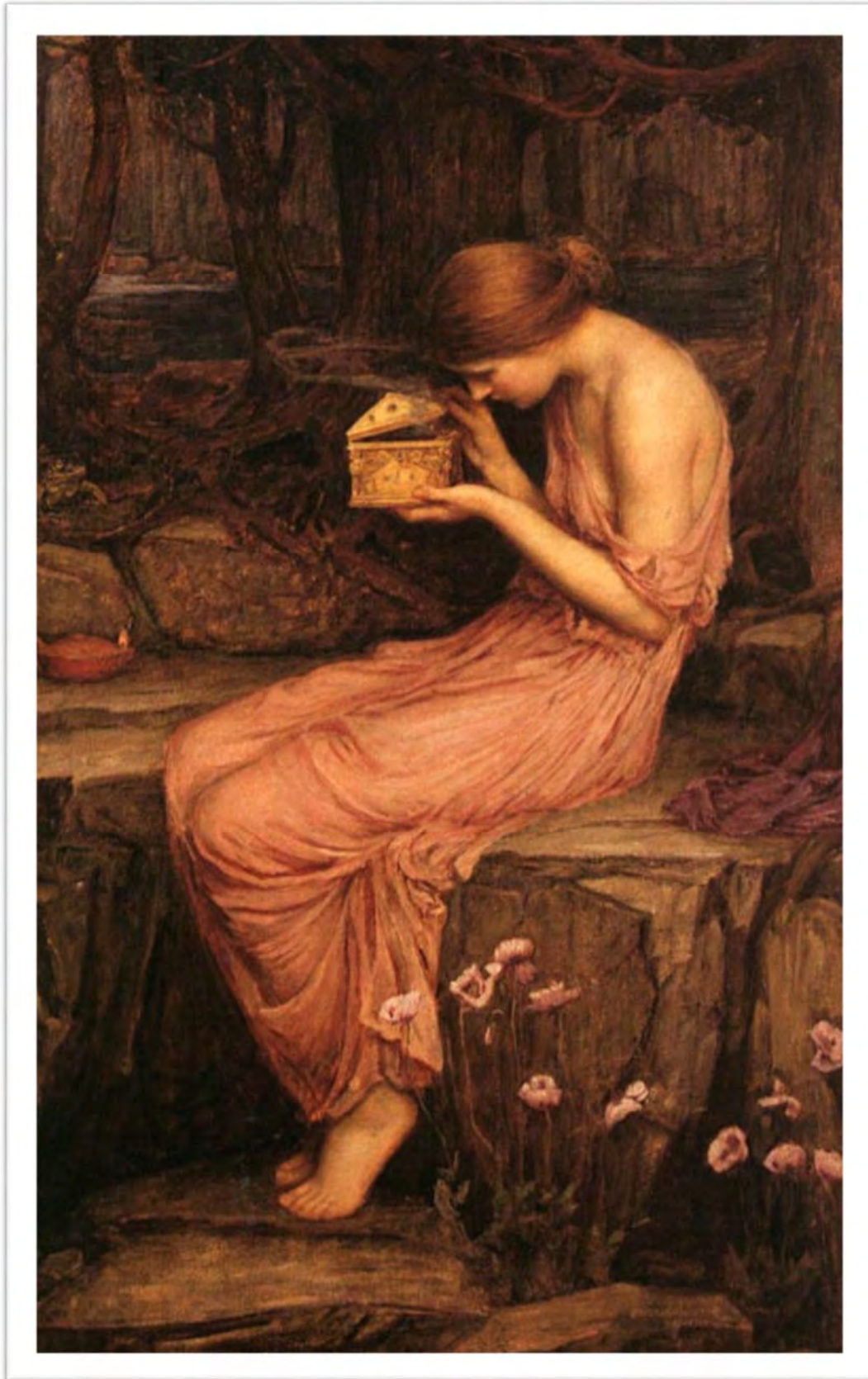
Waterhouse, John. Psyche Opening the Golden Box . 1903. https://commons.wikimedia.org/wiki/File:Psyche-Waterhouse.jpg